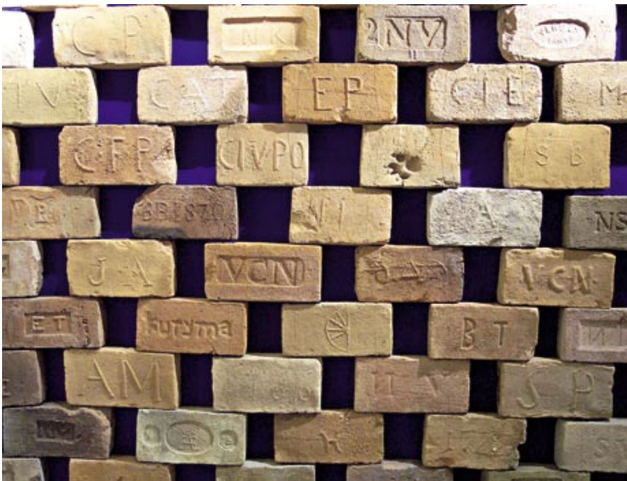
Galéria kolkovaných tehál