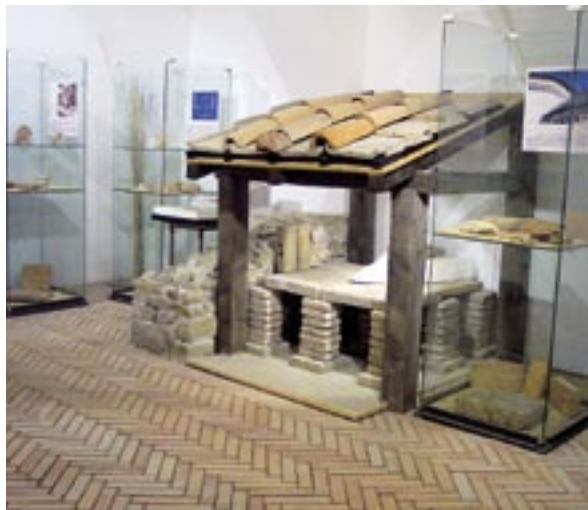
Rekonštrukcia stavebných prvkov rímskeho domu

Výstavu sponzorsky podporili TONDACH Slovensko s. r. o. a Wienerberger Slovenské tehelne s. r. o.